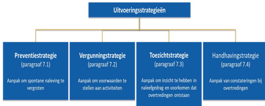
Figuur 2: Strategieën

Onze uitvoeringsstrategie is opgebouwd uit verschillende strategieën. De strategieën zijn gebaseerd op landelijke strategieën en zijn aangevuld met regionale afspraken en gemeentelijke werkwijzen. In figuur 2 zijn de strategieën en hun samenhang schematisch weergegeven.